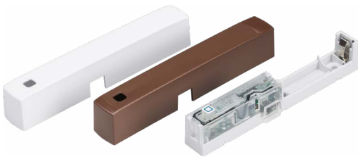
Kryt v bílé a hnědé barvě jsou součástí dodávky