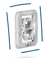
Kolébka a rámeček