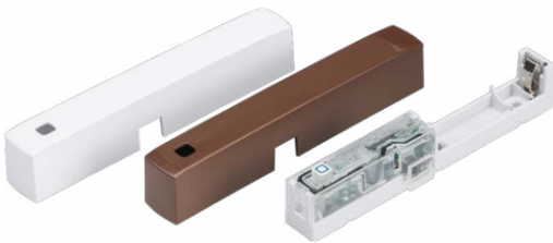
Kryt v bílé a hnědé barvě jsou součástí dodávky